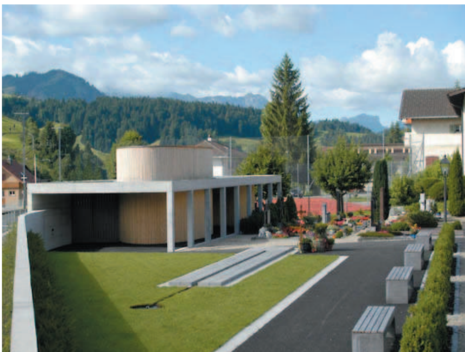
Aufbauungsraum in Escholzmatt

Standort: Friedhof Escholzmatt Bauherr: Einwohnergemeinde Escholzmatt Verfahrensart: Direktauftrag Baujahr: 2007